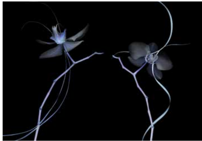
ADMG Orhydée blanc