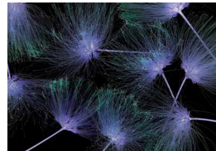
ADMG Fleur à soie