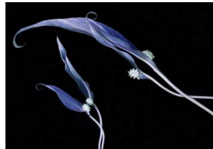
ADMG Fleur de lune