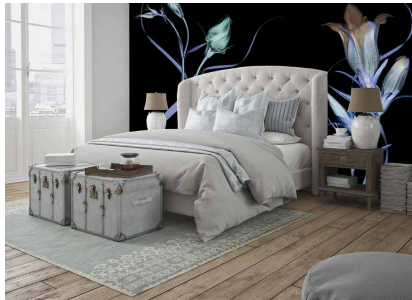
ADMG réa Lysanthius