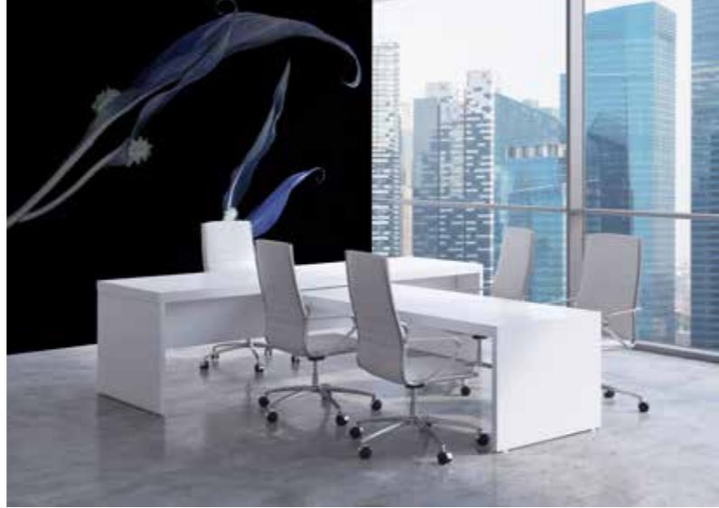
ADMG réa fleur de lune