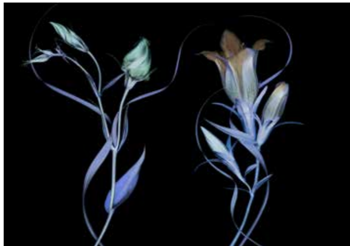
ADMG Lysanthius et gentiane