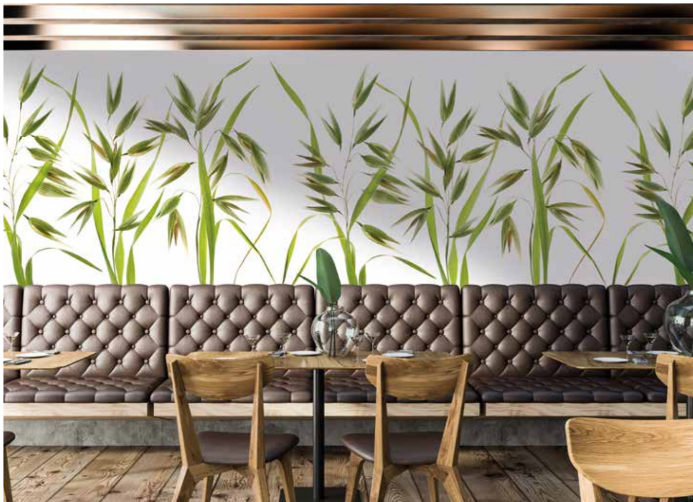
ADMG réa Avoine