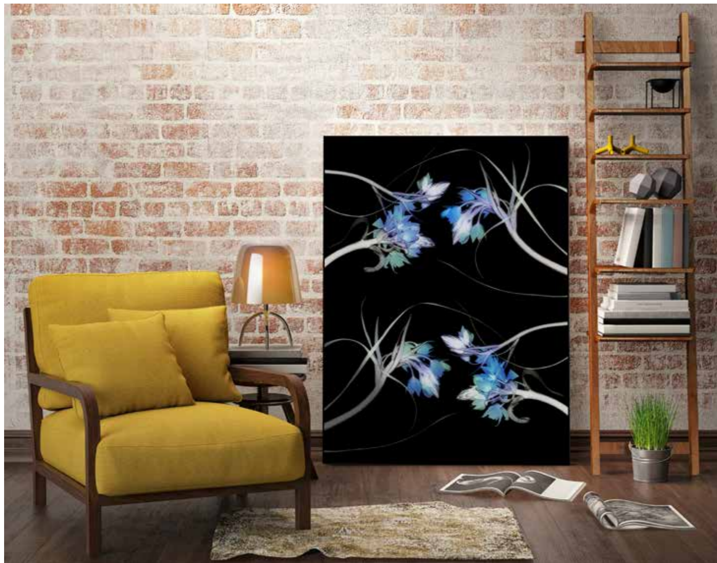
ADMG réa Ornithogalum