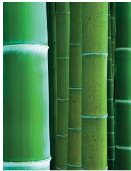
ADJDB Bamboos 8