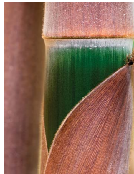
ADJDB Bamboos 6