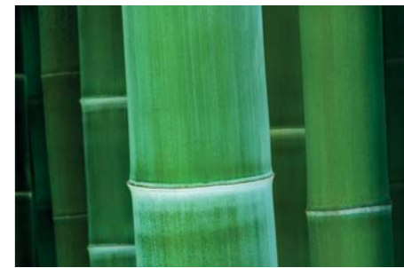
ADJDB Bamboos 7