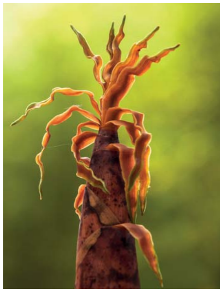
ADJDB Bamboos 13