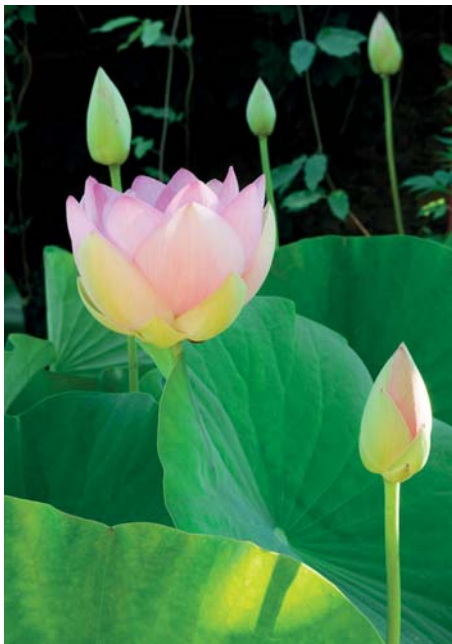
ADJDB Lotus 2