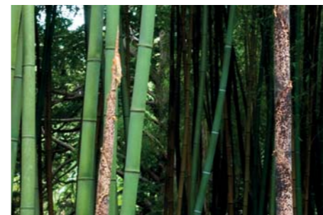
ADJDB Bamboos 14