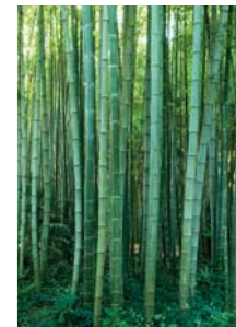
ADJDB Bamboos 16