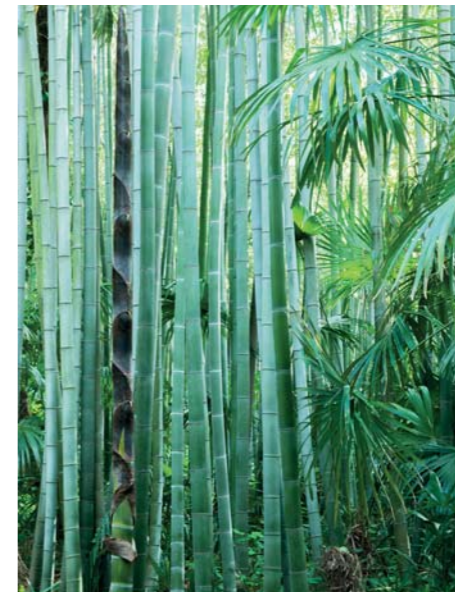
ADJDB Bamboos 12