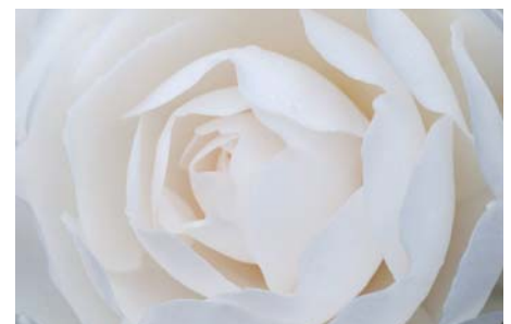
ADJDB Camellia 3