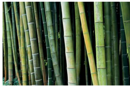
ADJDB Bamboos 11