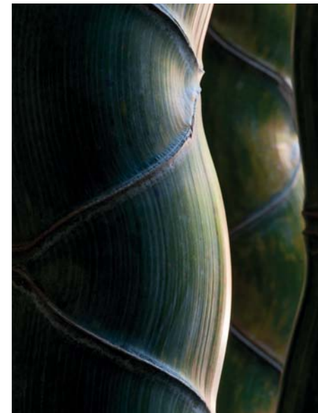
ADJDB Bamboos 10