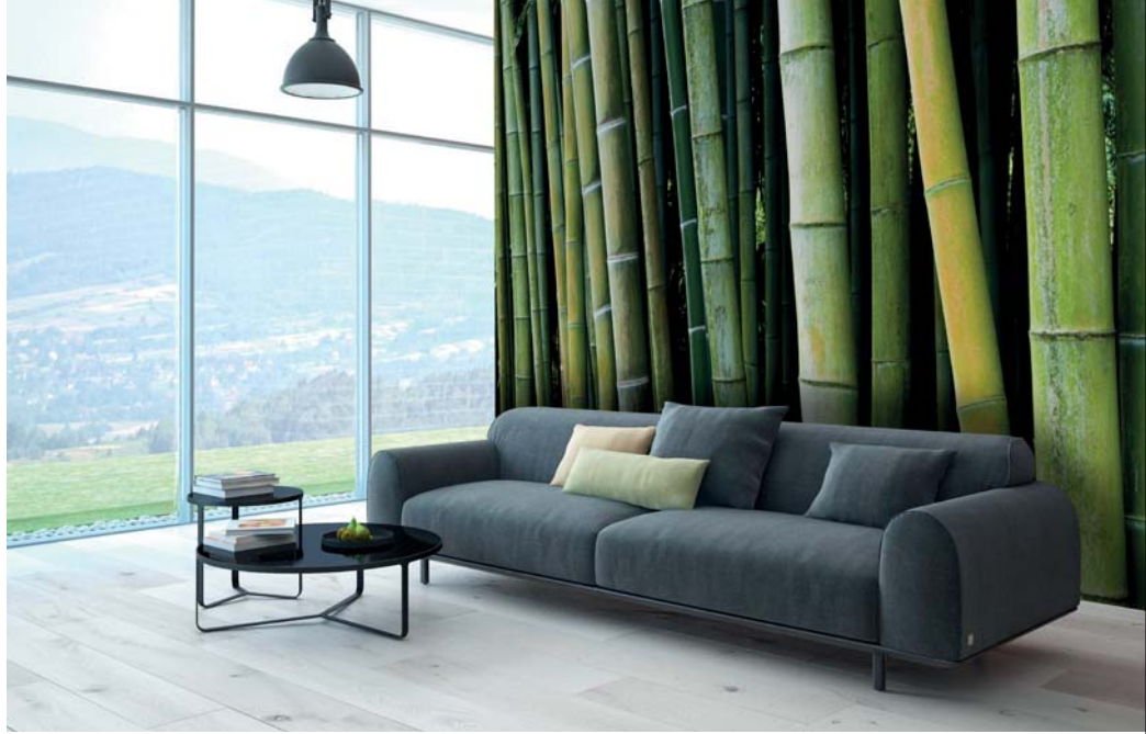
ADREA ADJDB Bambous 15