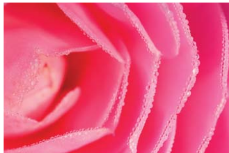
ADJDB Camellia 1