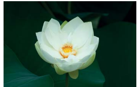
ADJDB Lotus 1