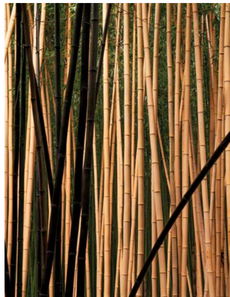
ADJDB Bamboos 1