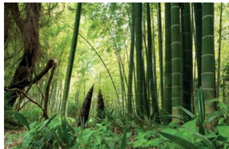
ADJDB Bamboos 4