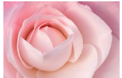
ADJDB Camellia 2