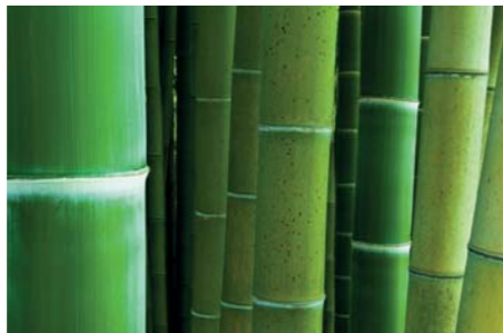
ADJDB Bamboos 9