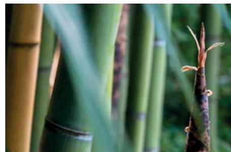
ADJDB Bamboos 5