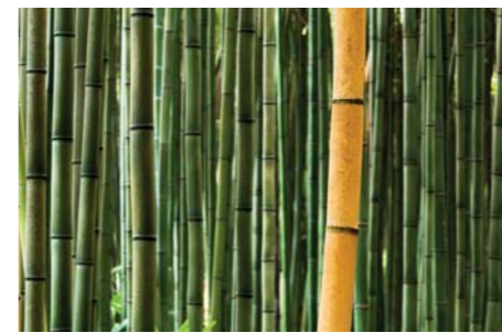
ADJDB Bamboos 3