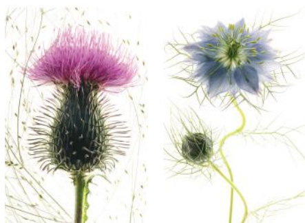
ADMG chardon sauvage ADMG nigelle bleue