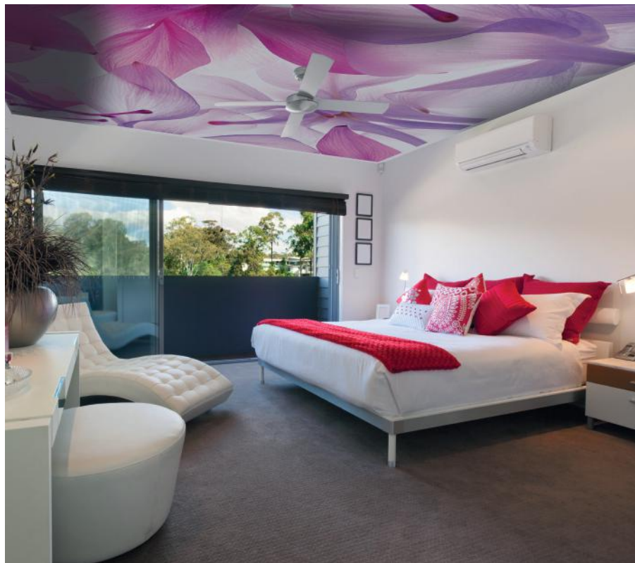
ADREA ADMG ancolie

Michel Gantner pour ALYOS , le 26 mai 2014