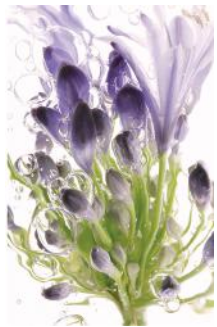
ADMG agapante 2

Mes visuels renoncent à toute ombre portée et à toute perspective, obéissant ainsi au principe de l'herbier, qui est une mise à plat d'une matière rendue quasi transparente. Travailler dans un environnement sombre me permet de voir ce que mon oeil ne perçoit pas en temps normal. Chacune de mes prises de vues devient alors un sujet d'étonnement et de surprise. Chaque nouvelle découverte contribue pour beaucoup à mon contentement.