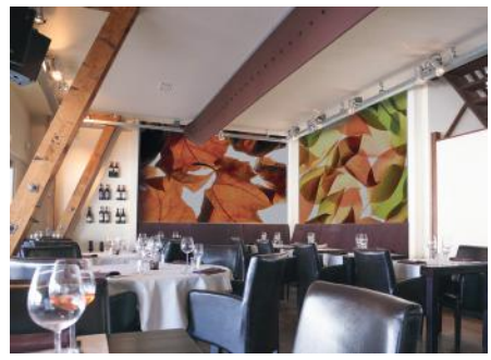
ADREA ADMG feuilles de platane et d'automne