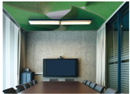
ADREA ADMG laurier rose