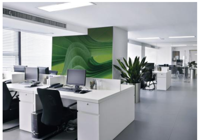
ADREA ADMG hosta