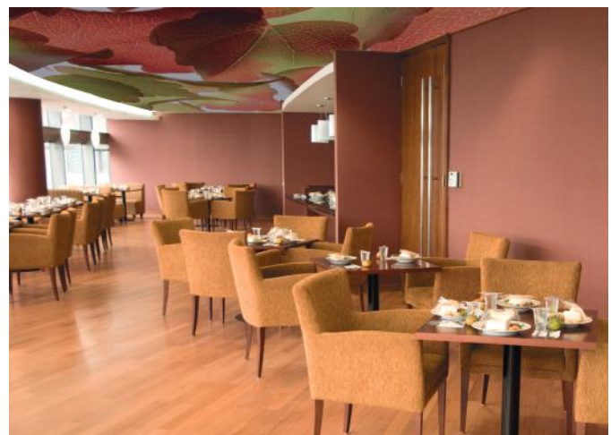
ADREA ADMG laurier rose