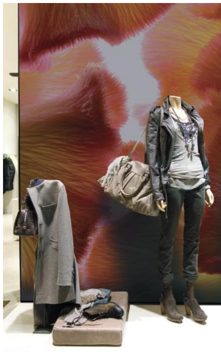
ADREA ADMG celosie