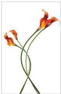
ADMG arum 2