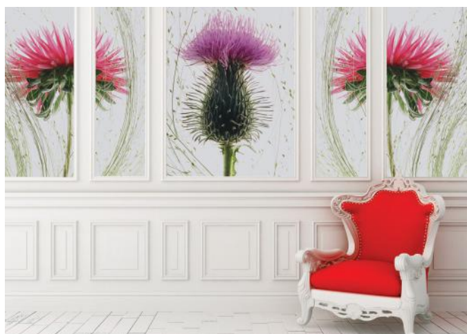
ADREA ADMG chardon sauvage et reine marguerite