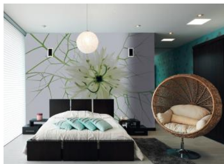
ADMG nigelle blanche 2 ADMG reine marguerite