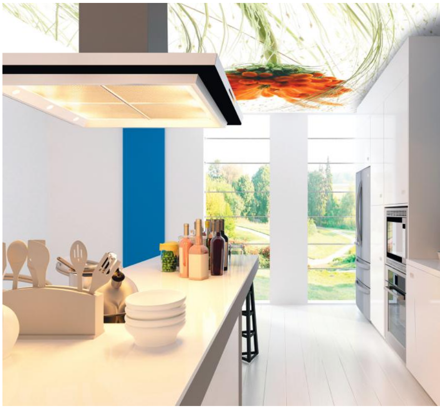
ADREA ADMG roi velour