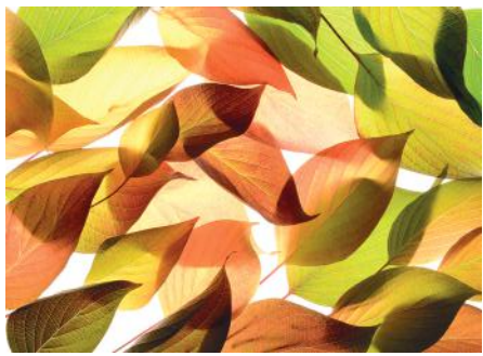
ADMG feuilles d'automne