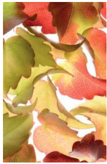
ADMG vigne vierge