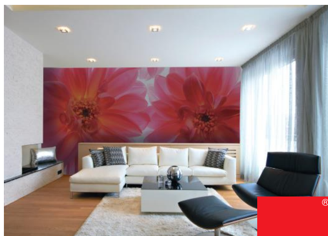
ADREA ADMG dahlias