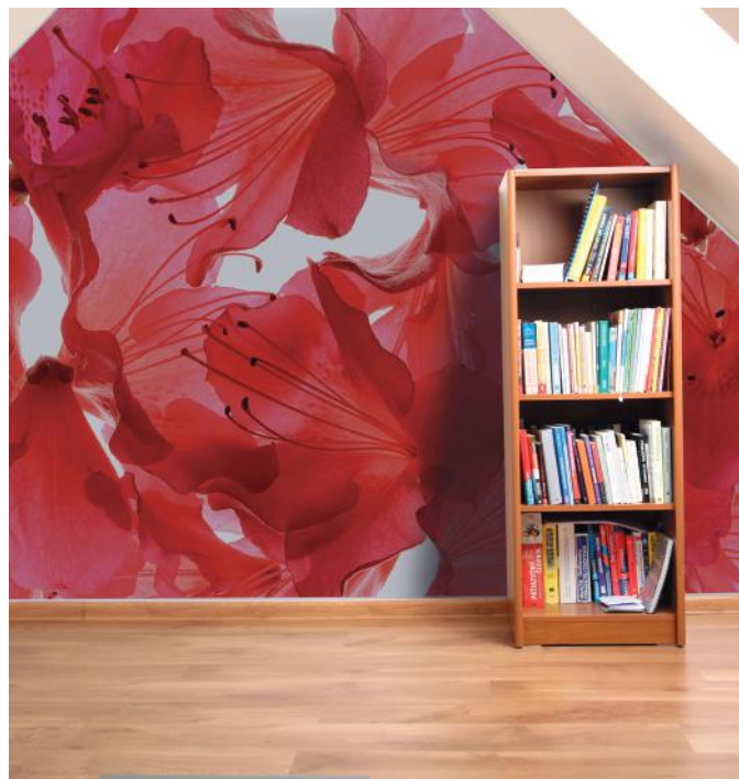
ADREA ADMG rhododendron