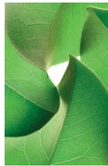
ADMG laurier rose