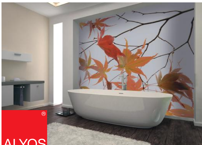
ADREA ADMG laurier rose