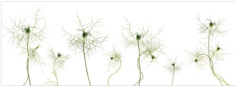
ADMG calice de nigelle 2