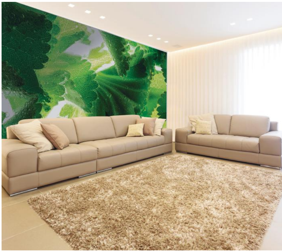
ADREA ADMG alchemille