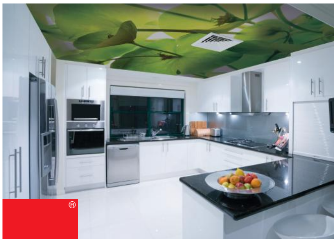
ADREA ADMG euphorbes