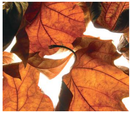
ADMG feuille de platane