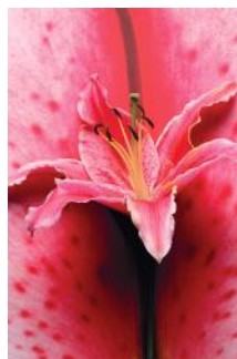
ADMG lys rouge