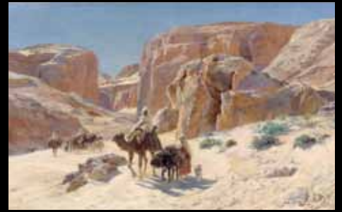
ADC216 - Caravane dans les dunes de Bou-Saada (1895), Eugène Alexis Girardet