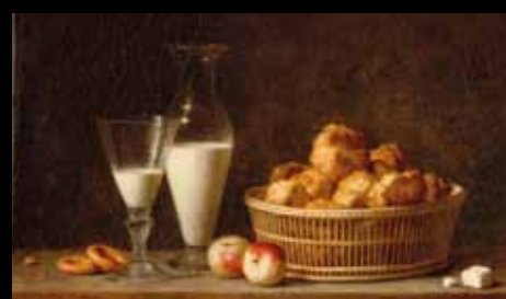
ADC236 – La petite collation (XVII e s.), Henri Horace Roland Delaporte