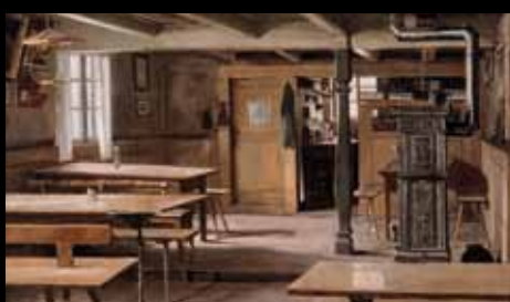
ADC235 – Intérieur de restaurant des environs de Strasbourg (XIX e s.), Émile Stahl