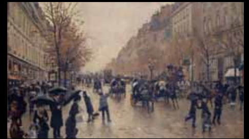
ADC227 – Boulevard Poissonnière sous la pluie (XIX e s.), Jean Béraud