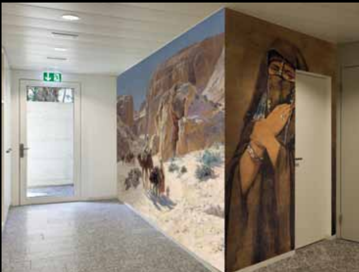
ADREA - ADC221 - Rue des Janissaires, Alger (XIX e s.), Émile Marquette ; ADC223 - Une Fellah (1861), Mathilde Bonaparte