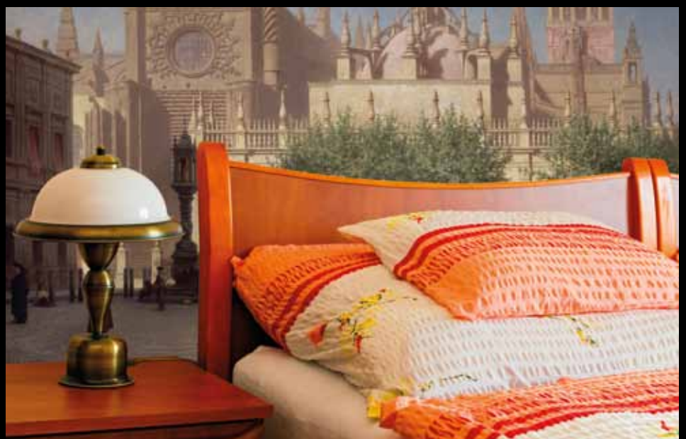
ADREA – ADC232 – La cathédrale de Séville (XIX e s.), Achille Zo