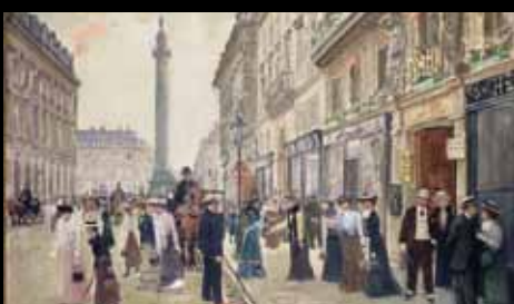
ADC231 – Sortie des ouvrières de la maison Paquin, rue de la Paix (XIX e s.), Jean Béraud