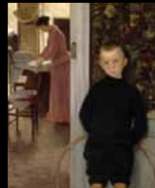
ADC256 – Enfant et femme (XIX e s.), Paul Mathey