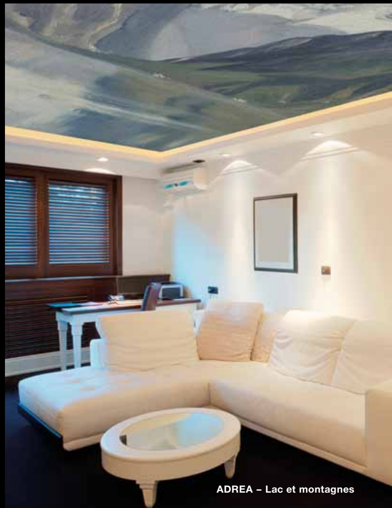
ADREA – Lac et montagnes