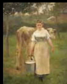
ADC252 - Mandan Lamétrie (XIX e s.), Alfred Roll