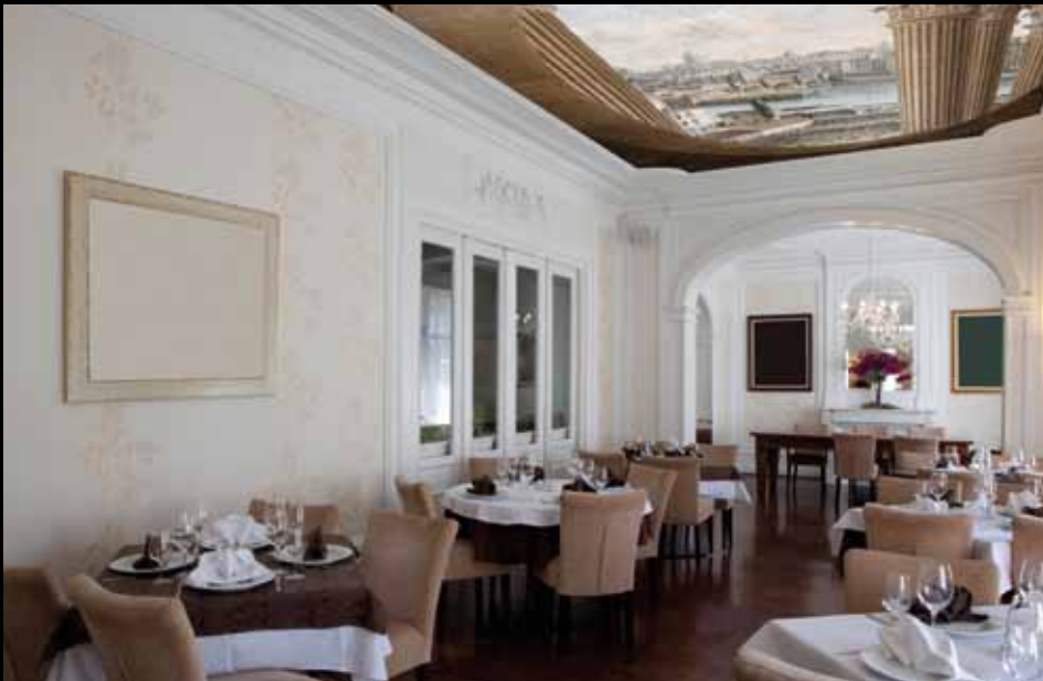
ADREA – ADC229 – Vue de Paris (XVIII e s.), Victor Jean Nicolle