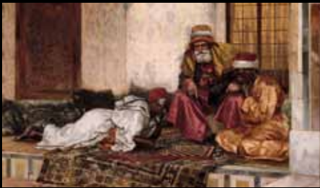
ADC238 - La partie d'échecs (XIX e s.), Rodolphe Ernst