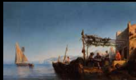
ADC259 – Le repas sous la pergola au bord du lac , Anonyme