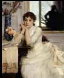
ADC247 - L'attente (XIX e s.), Georges Callot