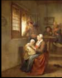
ADC239 - Femme allaitant son enfant (XVII e s.), Egbert Van Heemskerck