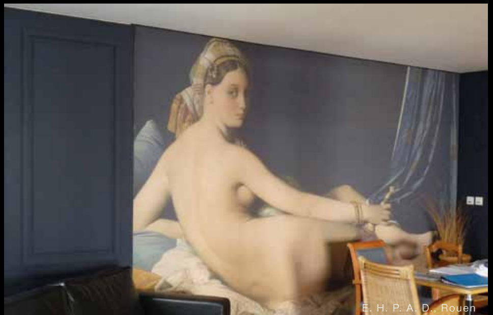
E. H. P. A. D., Rouen