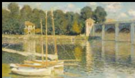
ADC261 – Le pont d'Argenteuil (XIX e s.), Claude Monet