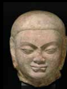
ADC214 - Tête de thirtankara (II e s.), Dynastie Kusana