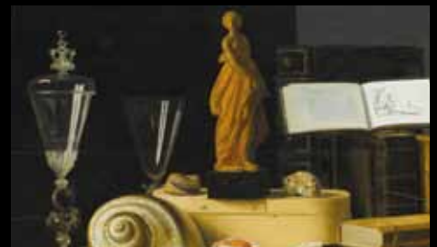
ADC244 - Nature morte à la statuette et au coquillage (XVII e s.), Sebastian Stoskopff