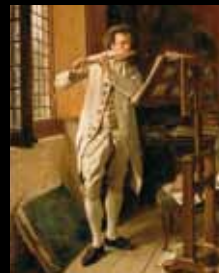
ADC245 - Joueur de flûte (XIX e s.), Jean-Louis Ernest Meissonier