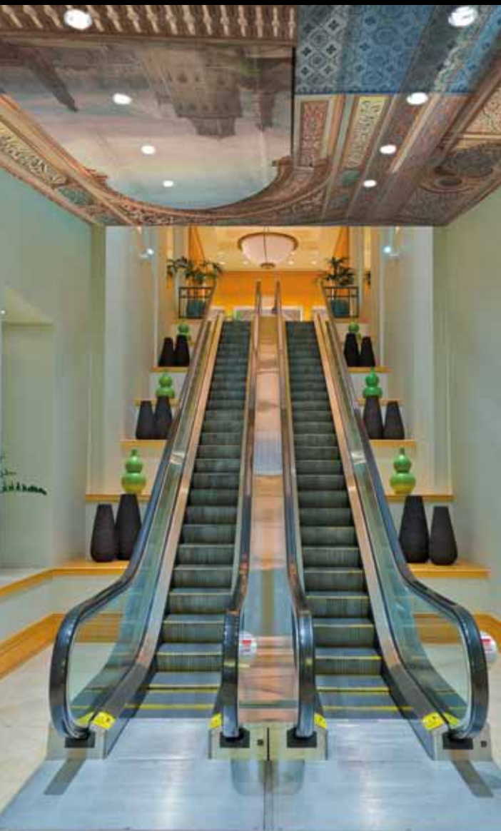
ADREA- Décor de théâtre mauresque