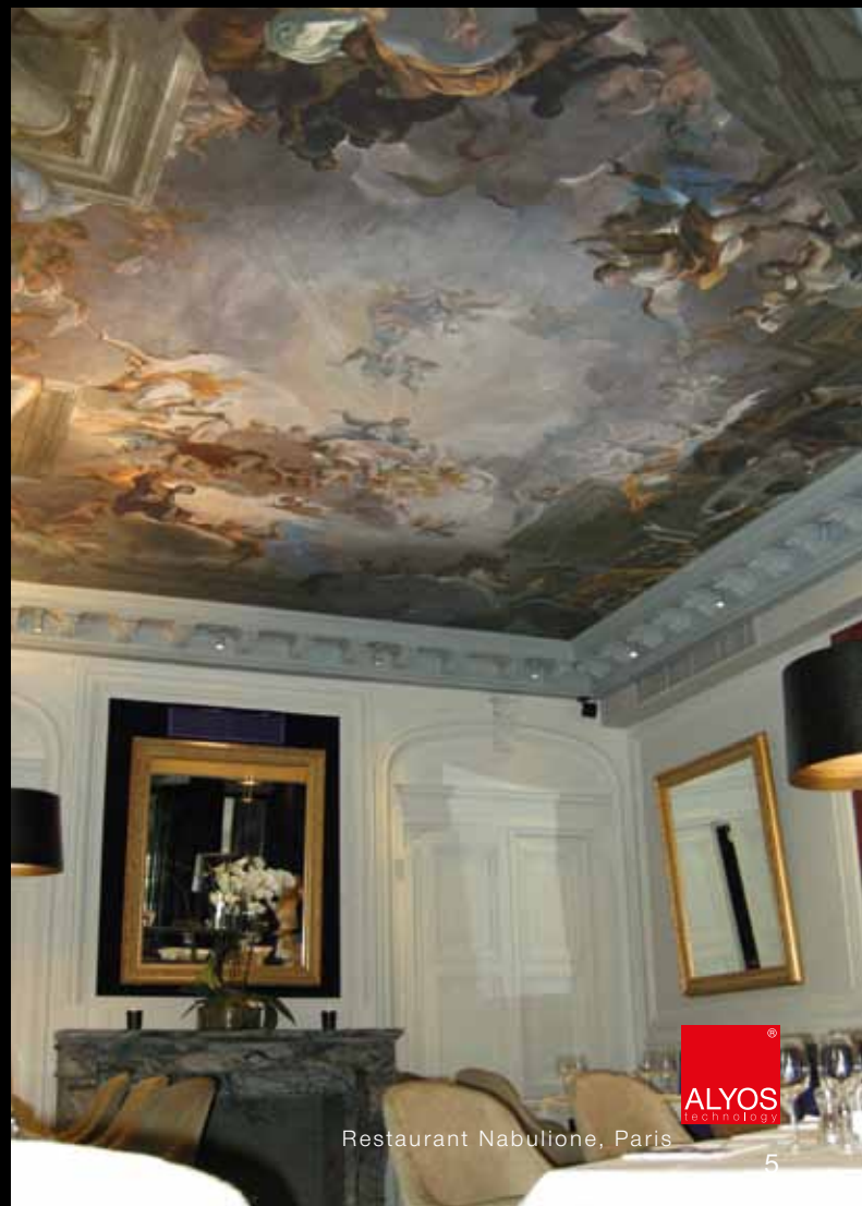
Restaurant Nabulione, Paris