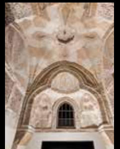
ADC209 - Porche du Qasr Rumi (XV e s.), Période Mamelouk