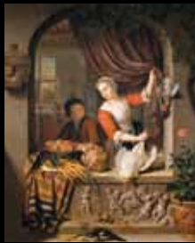
ADC242 - La cuisinière (XVII e s.), Willeme Van Mieris