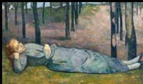
ADC250 - Madelein au Bois d'amour (1888), Émile Bernard