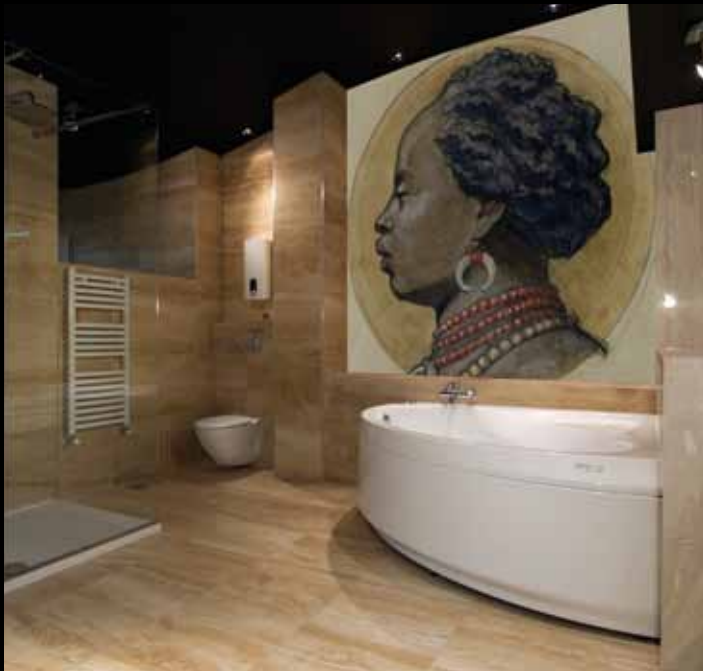
ADREA - ADC217 - Comptoir d'escompte : Africa (1880), Charles Lameire