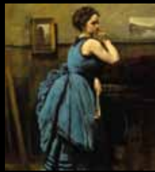
ADC253 – La dame en bleu (XIX e s.), Jean-Baptiste Camille