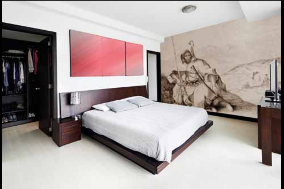
ADREA - ADC218 - Soldat de la guerre de l'empereur du Maroc (1845), Frédéric Villot