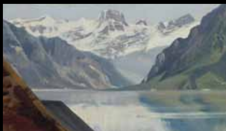
ADC260 – Lac et montagnes (XVIII e s.), Achille Etna Michallon