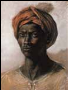
ADC222 - Nègre au turban (1826), Eugène Delacroix