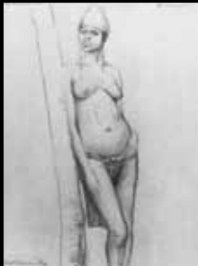
ADC224 - Femme nue Gabon (XIX e s.), Edmond Laethier