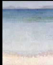
ADC258 – Les îles d'or (XIX e s.), Henri Edmond Cross