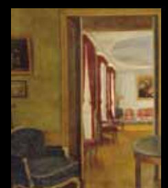
ADC237 – Intérieur (XIX e s.), Henri Georges Ballot