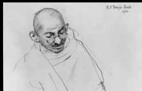
ADC211 - Gandhi (1932), Kathleen E. Temple Bird