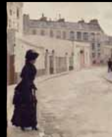
ADC257 – L'attente, rue de Chateaubriand (XIX e s.), Jean Béraud