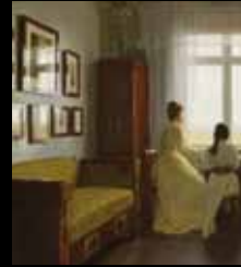
ADC254 – Intérieur (XIX e s.), Georg Nicolaj