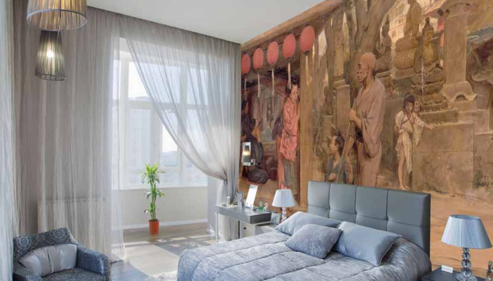
ADREA - ADC210 - Boutique de tir à l'arc (1876) Félix Élie Regamey