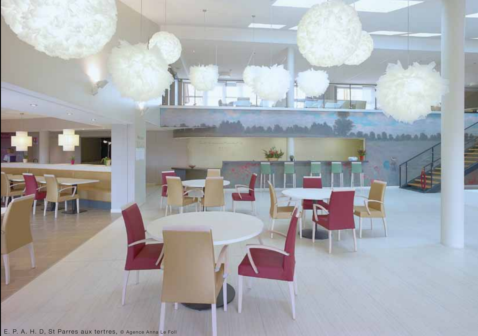
E. P. A. H. D, St Parres aux tertres