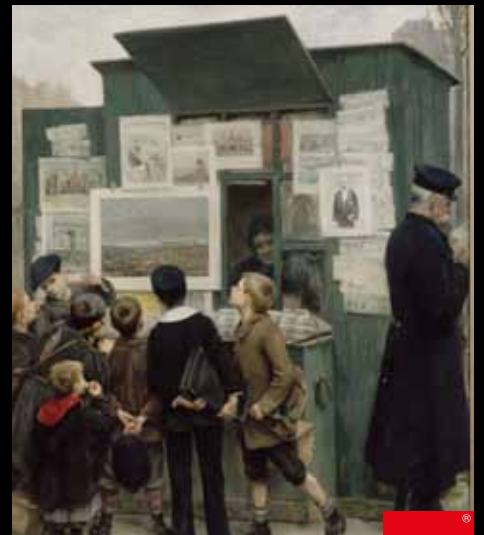
ADC225 - Devant le Rêve de Détaille (1897), Paul Legrand