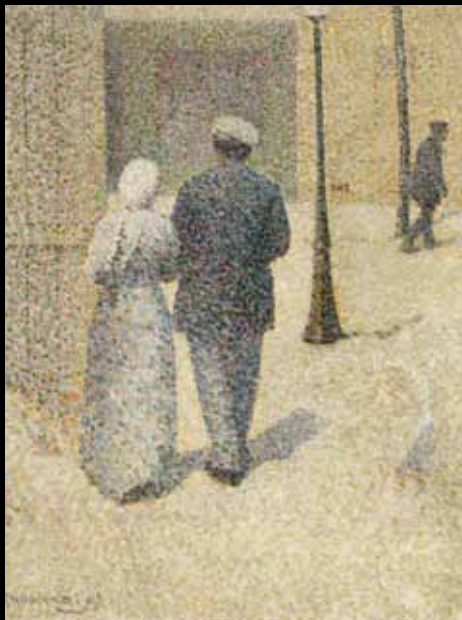
ADC226 – Couple dans la rue (1887), Charles Angrand