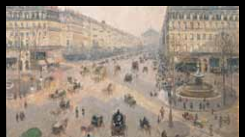
ADC234 – Avenue de l'Opéra, soleil, matinée d'hiver (XIX e s.), Camille Pissarro