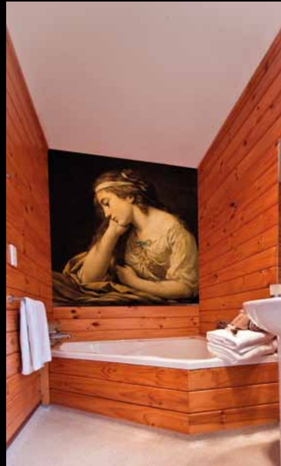
La mélancolie (XVIII e s.), Louis Jean François Lagrenée