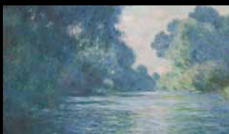
ADC262 – Bras de Seine près de Giverny (XIX e s.), Claude Monet