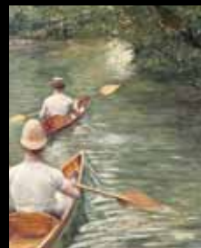
ADC263 – Les Périssaires (XIX e s.), Gustave Caillebotte