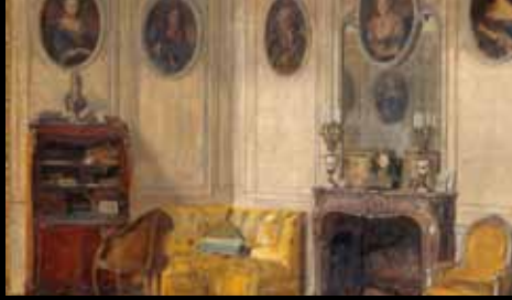
ADC241 - Chateau de Bréau, intérieur (XIX e s.), Walter Gay