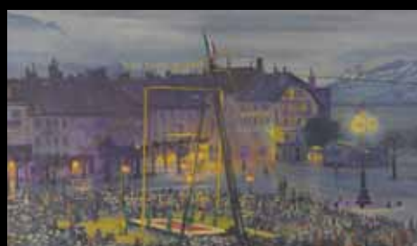
ADC233 – Le Cirque (XIX e s.), Kamir