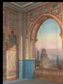
ADC213 - Décor de théâtre mauresque (XIX e s.)