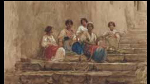
ADC230 – Tresseuses de cordages (XIX e s.), Ernest Antoine Auguste Hébert