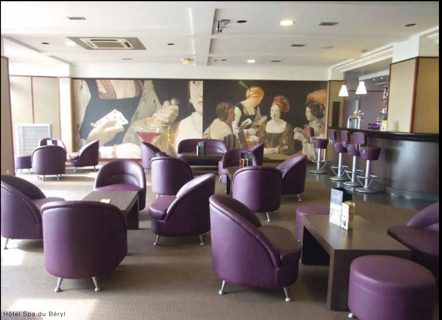
Hôtel Spa du Béryl