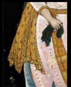
ADC215 - Portrait du sultan Ibrahim Adil Shah II (1615)