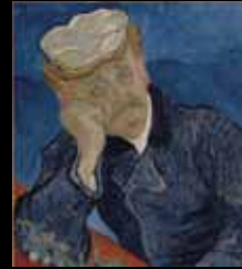
ADC255 – Le docteur Paul Gachet (XIX e s.), Vincent Van Gogh