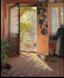
ADC240 - Intérieur (XIX e s.), Charles Clément Francis Perron