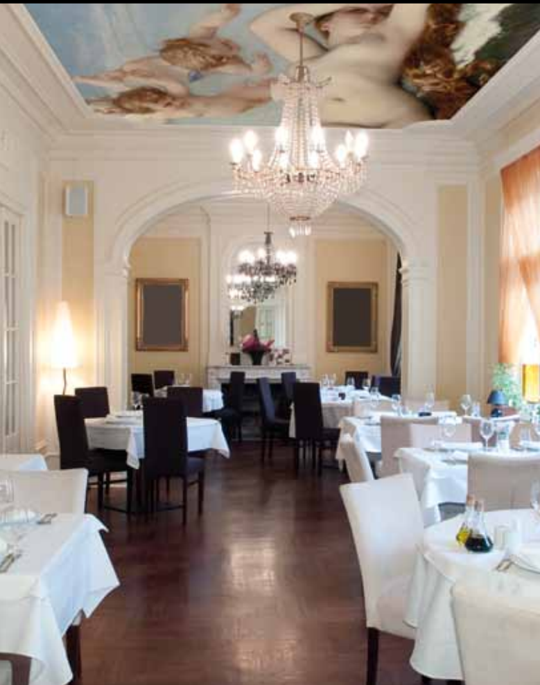
ADREA – ADC248 – Naissance de Vénus (XIX e s.), Alexandre Cabanel