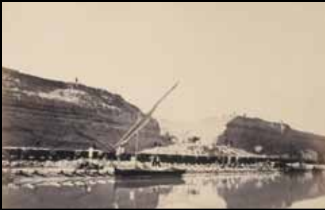
ADC220 - Isthme de Suez (1866), Cuvier