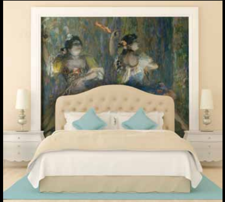
ADREA ADC243 - Deux danseuses espagnoles (XIX e s.), Juan Roig y Soler